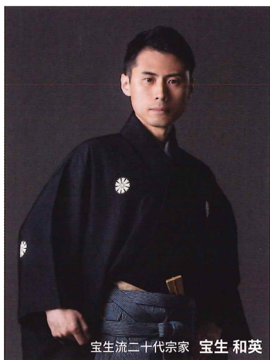
宝生流二十代宗家 宝生 和英

一人でも多くの人に「能」の世界へ一歩を踏み出してもらいたい 「能」には五感をつかいリラックスした空間で贅沢な時間を過ごす楽しみもあります